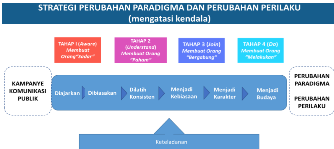
Gambar 3: Strategi Penguatan Karakter Ke Depan (Pusat Penguatan Karakter, 2020) 9

Kementerian Pendidikan dan Kebudayaan dibawah kepemimpinan Nadiem Anwar Makarim akan menggunakan pendekatan yang cenderung lebih berfokus pada prinsip efisiensi. Program-program yang terkait penguatan pendidikan karakter tidak lagi menggunakan pola-pola lama yang lebih kepada pelatihan-pelatihan guru atau kepala sekolah atau siswa; atau menggunakan pola workshop serta diseminasi pada level kabupaten/kota ke daerah. Pendekatan yang akan dilakukan lebih kepada melakukan kampanye media ( media-campaign ). Kampanye dimaksud akan menggunakan strategi yang ditujukan mengubah paradigma dan perilaku sebagai terlihat pada Gambar 3 berikut.