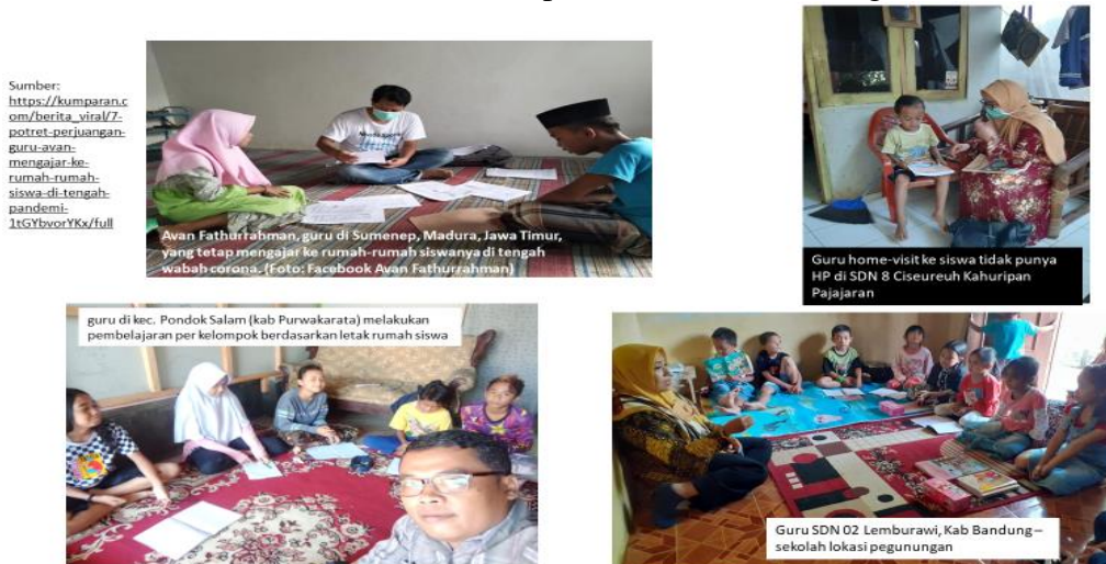
Gambar 5: Penerapan Nilai Karakter Integritas

Terkait dengan nilai integritas maka apa yang dilakukan para guru yang bersedia melakukan kunjungan ke rumah-rumah siswa ( home-visit ) merupakan bukti penerapan nilai karakter integritas. Kunjungan mereka tersebut didasarkan atas niat untuk memastikan bahwa