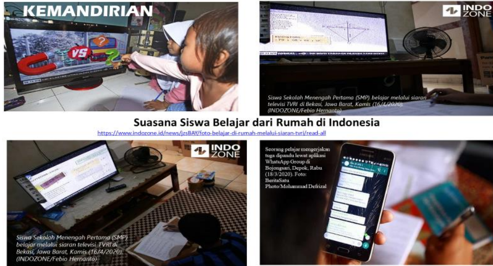
Suasana Siswa Belajar dari Rumah di Indonesia https://www.indozone.id/news/72584V/foto-belajar-di-rumah-melalui-siaran-tvri/read-all

Gambar 4 di atas menunjukkan bahwa para siswa telah mampu mengikuti instruksi atau tugas yang diberikan guru mereka dengan menggunakan koneksi dalam jaringan ( online ). Foto-foto di atas memperlihatkan bahwa walaupun dengan kondisi yang relatif berbeda antara satu siswa dengan yang lain, mereka mampu menyelesaikan tugas yang diberikan. Dalam beberapa kasus ditemukan adanya siswa yang harus menunggu sampai orang tuanya pulang ke rumah untuk dapat mengirimkan tugas kepada guru dengan menggunakan WhatsApp (WA).