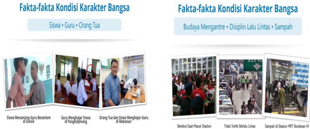
Gambar 1: Fakta-fakta Kondisi Karakter Bangsa

Berbagai pemberitaan di media menunjukkan kasus-kasus tersebut di berbagai lapisan masyarakat, tidak hanya di daerah atau kota besar saja tetapi juga sudah menjadi bagian dari kehidupan di berbagai pelosok. Padahal, di dalam proses pembelajaran selalu disampaikan pentingnya budaya antri atau disiplin berlalu lintas atau membuang sampah agar tidak menimbulkan masalah bagi masyarakat. Dalam hal antri menunggu giliran ketika di Bank atau di tempat layanan masyarakat, banyak yang tidak tahan untuk menunggu lama. Dalam berbagai kesempatan sering ditemui ada yang tiba-tiba menerobos ke depan melewati urutan yang seharusnya di belakang. Padahal kita datang terlambat sementara yang lain sudah rapi antri lebih awal (dalam Hendarman, 2020) 5 .