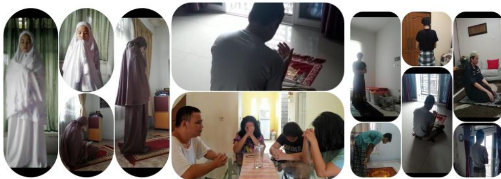
Kegiatan sapa dan doa bersama agar Allah SWT segera mencabut COVID -19 lenyap dari bumi ini dipimpin oleh walikelas secara online dalam rangka Hardiknas di SMPN 1 Kota Bogor.

Dalam kaitan dengan penanaman nilai karakter religiositas terdapat contoh yang menarik dari siswa-siswa Sekolah Menengah Negeri 1 Kota Bogor. Pada waktu menyambut Hari Pendidikan Nasional 2 Mei 2020 maka guru kelas mempunyai inisiatif untuk berdoa bersama,